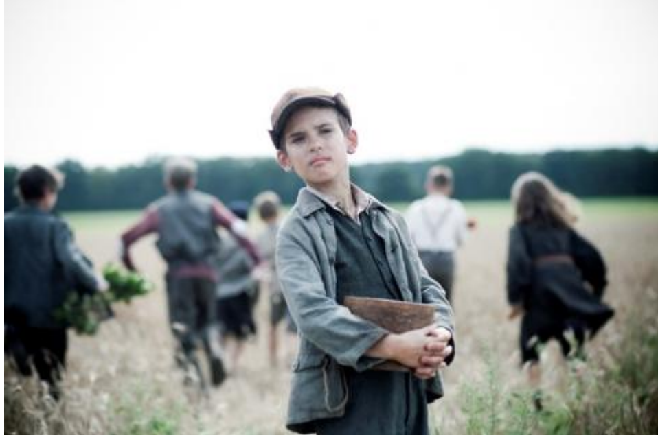
Era costretto a lavorare